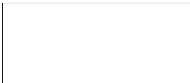
Gambar x. Judul gambar (11pt), center